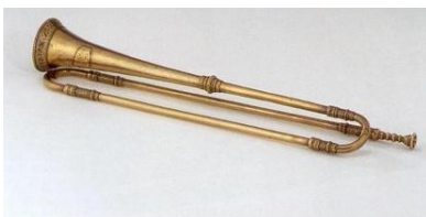
1599 (musée de la musique – Paris)

La TROMPETTE NATURELLE, dépourvue de pistons, n'émet que les harmoniques naturelles d'un son fondamental, obtenues par pression plus ou moins forte des lèvres. Ces harmoniques sont plus nombreuses dans les aigus ce qui explique que les compositeurs baroques aient utilisé la trompette surtout dans le registre aigu.